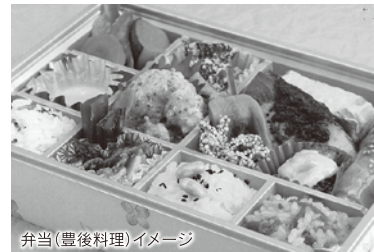
弁当(豊後料理)イメージ